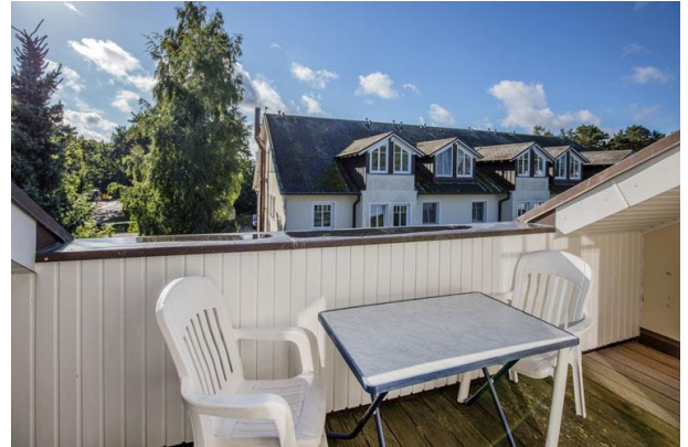
Vom Wohnzimmer aus haben Sie direkten Zugang zum Balkon.

Die einzelnen Häuser, die sogenannten Dünen, spiegeln mit ihren Holzbalkonen, Spitztürmchen und Zierelementen aus Kupfer die charakteristische Bäderarchitektur der Jahrhundertwende wieder.