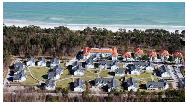
Die großzügig angelegte 4-Sterne-Ferienwohnanlage liegt nur wenige Schritte vom Strand entfernt.